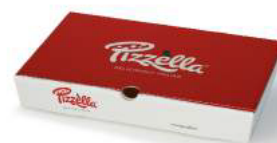
Take away Pizzella dozen

Deze promo geeft u de mogelijkheid om met een minimale investering een echt totaalconcept in huis te halen. Daarbovenop ontvangt u gratis 36 Pizzella's ( 12 pepperoni, 12 vierkazen, 12 ham-champignon). Zo verdient u een belangrijk deel van uw aankoopbedrag terug, na verkoop.