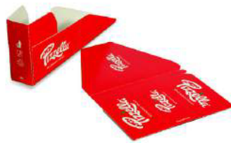
On-the-go Pizzella houders