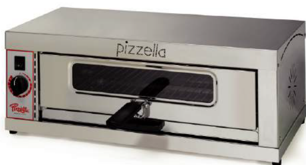
Oven voor 3 Pizzella's (3,0 kW) – 62x34x24h cm